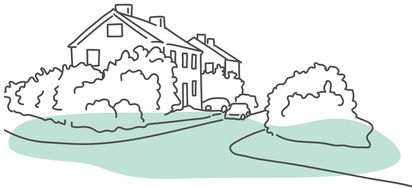
Eksempel på illustration, der er placeret indefor guidelines