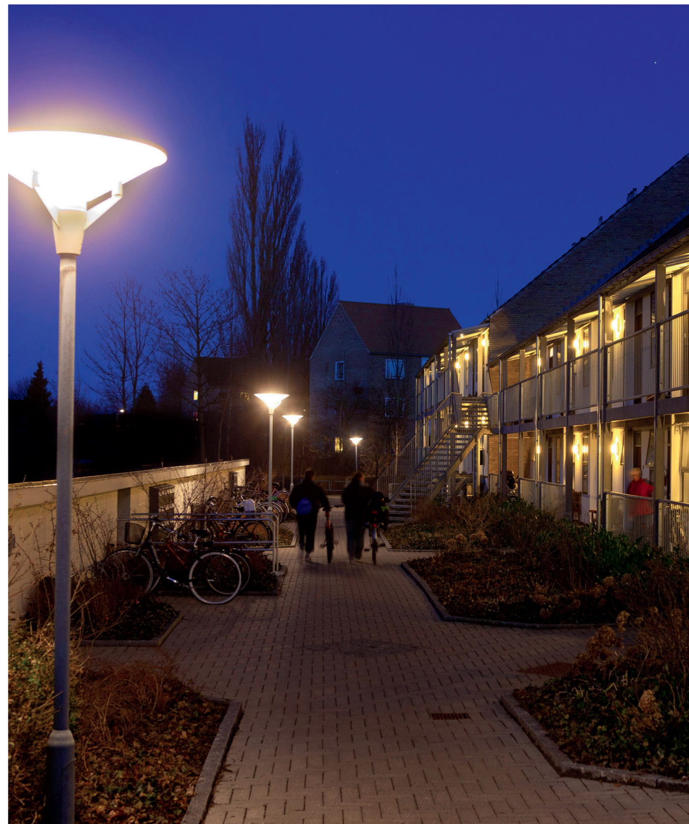
Eksempel på helsides foto - den maksimale billedstørrelse. Læs mere på www.inspirationskatalog.dk .