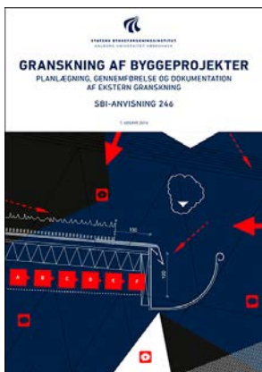
Forside SBI-anvisning 246.